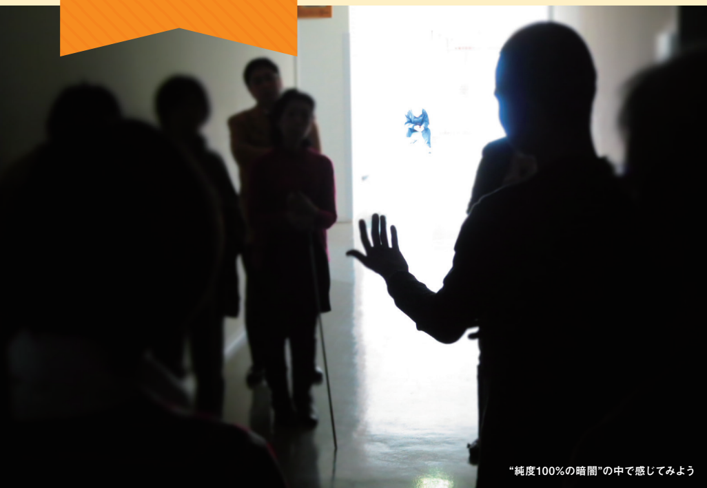
“純度100%の暗闇”の中で感じてみよう

ダイアログ・イン・ザ・ダークは、視覚障害者の案内により、完全に光を遮断した“純度100%の暗闇”の中で、視覚以外の様々な感覚やコミュニケーションを楽しむソーシャル・エンターテインメントです。